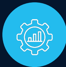
Empresas de servicios